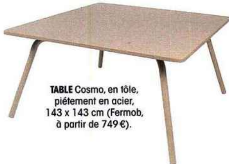
TABLE Cosmo, en tôle, piétement en acier, 143 x 143 cm (Fermob, à partir de 749 €).

CANAPÉ Along, en bois exotique recouvert de rotin, 279 x 79 x 100 cm (Fly, 690 €).