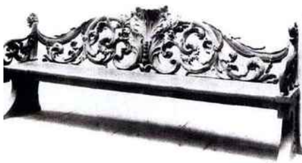
BANC BARUTIN À DOSSIER SCULPTÉ, RECRIÉ D'APRÈS UN MODÈLE ANCIEN.

Désormais les concepts expérimentaux bousculent aussi l'art de vivre en extérieur. Ainsi la chaise longue dessinée par Oki Sato, fondateur du studio Nendo à Tokyo pour Tectona, offre une ligne et des propositions inhabituelles. Avec son repose-pieds grandeur nature, elle parie sur des proportions à la limite de l'harmonie. Le confortable dossier de l'assise et son couvercle pyramidale dissimulent astucieusement un bel espace de rangement. Ni vu ni connu.