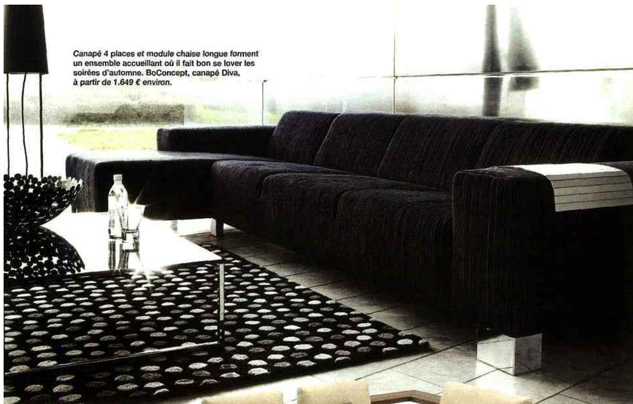
Canapé 4 places et module chaise longue forment un ensemble accueillant où il fait bon se lover les soirées d'automne. BoConcept, canapé Diva, à partir de 1.649 € environ.