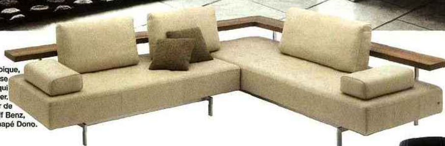
► Innovant et atypique, cet élément se singularise par sa tablette en bois qui court le long du dossier. Un modèle à recouvrir de cuir ou de tissu. Rolf Benz, canapé Dono.